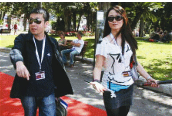
贾樟柯(左)就是从拍短片开始引起影坛关注的

对于影片的主题,他也有自己的道理,“我看很多大学生作品还在讲爱情,但是到了我这个年龄爱情已经不重要了,我会想究竟人一生中最大的敌人是谁,而对于一个女人来说,她最大的敌人就是另一个优秀的女人。”(冬妮)