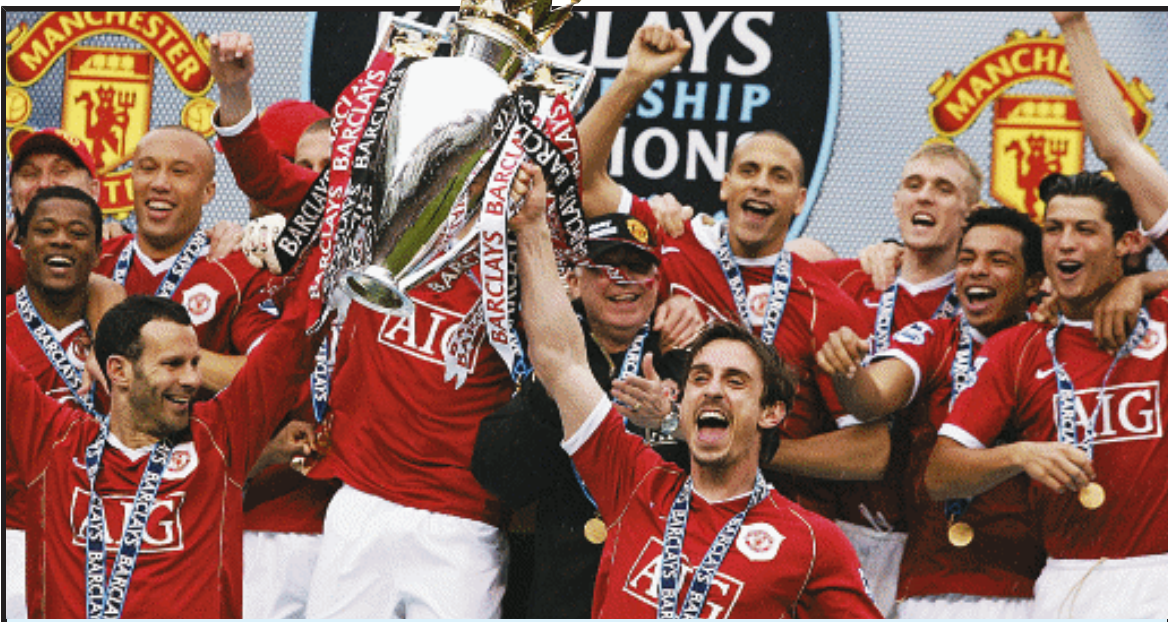
红魔将幸福建立在谢联的痛苦之上