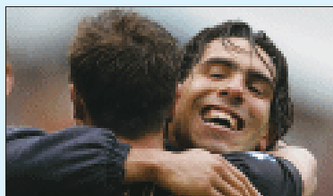
西汉姆保级,打入一球的特维斯激动不已

北京时间前晚,本赛季英超上演最后一轮的收官之战。虽然西汉姆队大爆冷门,1:0挫败已经登上冠军宝座的曼联,但丝毫没有影响红魔的登基大典。对于老特拉福德球场的7万多名球迷而言,他们到现场就是为了观看赛后的颁奖仪式。伴随着璀璨的焰火,曼联球员终于在4年中首次捧起英超冠军奖杯,弗格森和内维尔率领大家登上冠军领奖台,哪管由于自己最后一战的“晚节不保”将谢联踢下了降级的悬崖。