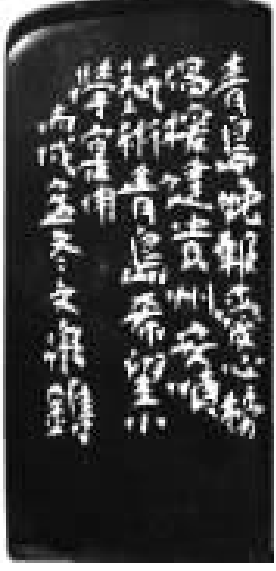
艺术青岛(附边款) 刘文泉/作