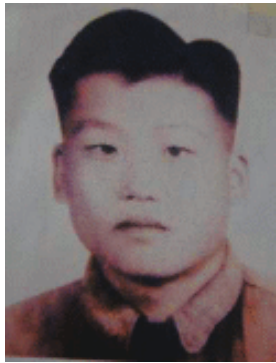
当我们翻开抗美援朝的历史记载,1953年7月,这已经是抗美援朝的最后阶段,抗美援朝成为他们挥之不去的伤痛,

援朝停战协议的签订就在1953年7月27日,就在这最后的关头他倒在了朝鲜的土地上,长眠在异国他乡,这位风华正茂,朝气蓬勃的年轻人,用他十八岁的青春韶华谱写了一曲英雄赞歌。