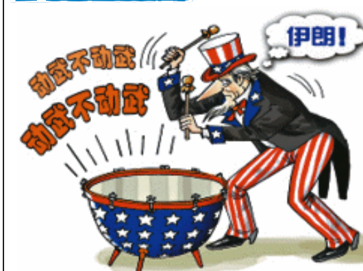
山姆擂战鼓