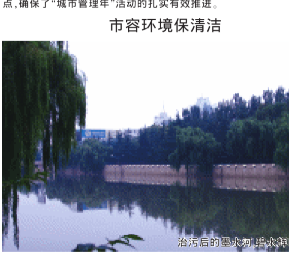
治污后的墨水河,碧水环绕蓝天

市容环境保洁,既是一项城市美容工程,也是一项民生工程。即墨市按照城乡环境综合整治的总体要求,围绕“美化环境,提升形象,改善民生”的工作目标,对城市环境卫生、环境保护、占道修车洗车、乱贴乱画等市容环境问题实施精细化管理,努力创造清洁、健康、绿色的人居环境。 一是提高环卫保洁水平。按照“城市管理年”活动的要求,即墨市对城乡建设局、城管执法局等有关部门和各街道办事处的工作职责进行明确分工,对城乡结合部、城区出入口、城市道路、背街小巷、河道及两侧、道路绿化带等区域的“脏乱差”现象,实施了定人、定位、定时、定责、定标准的“五定”管理模式,加强日常环境卫生管理,消灭环卫作业盲区和管理死角。启动了移动式压缩垃圾中转站工程项目建设及配套设施建设,新设置垃圾容器桶、果皮箱1540个,建成压缩式垃圾中转站3座,小型中转站50座,购进移动式垃圾压缩中转站及100个收集桶,5座微生物发酵处理厂已经竣工,正在开工建设。在振华苑等6个居民小区,开展了垃圾分类收集试点。在城市建成区136个村庄,开展以“三清”、“四改”、“五化”(即清垃圾、清污水、清柴垛,改水、改路、改灶、改厨,硬化、绿化、亮化、美化)为主要内容的环境卫生综合治理,建立了垃圾收集系统和无害化处理设施,推行垃圾袋装化和有偿清运,实现生活垃圾日产日清和无害化处理目标。完成城区6条主干道和216条背街小巷的环境综合整治,清除积存垃圾和白色垃圾,有效改善了城市环境。今年以来,全市共出动各类机械760多车次,人工1.2万人次,整治卫生死角260余处,清运垃圾5600多吨,清理绿化带6000余平方米。 二是实施城市净化工程。加大大气污染防治工作力度,完成了青岛新源热电有限公司和即发龙山工业园各2台75吨燃煤锅炉安装脱硫设施的筛选工作,目前已开始前期土建工程。规划建设3.5平方公里烟尘控制区,烟尘控制区覆盖率保持100%。加强机动车排气污染防治,已检测机动车1672辆,合格1543辆,排气达标率92.3%。加强城区河道治理,成立了河道综合执法和专业保洁队伍,坚持每天巡查河道,