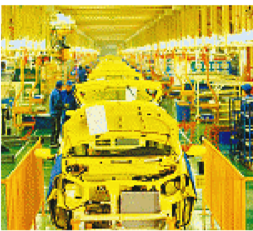
在半岛制造业基地,汽车及零部件产业成长迅速。

青岛、烟台、威海三市整合资源,引进资金与调整半岛基地产业结构有机结合,招商质量层次明显提高,环境竞争力日益增强